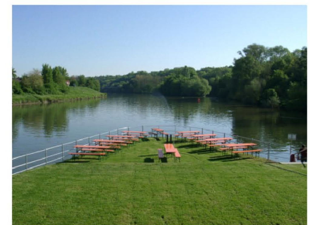
Beispielbilder Umgestaltung Haldenbach