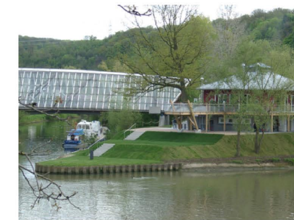
Beispielbilder Birkelspitze mit Gastronomie