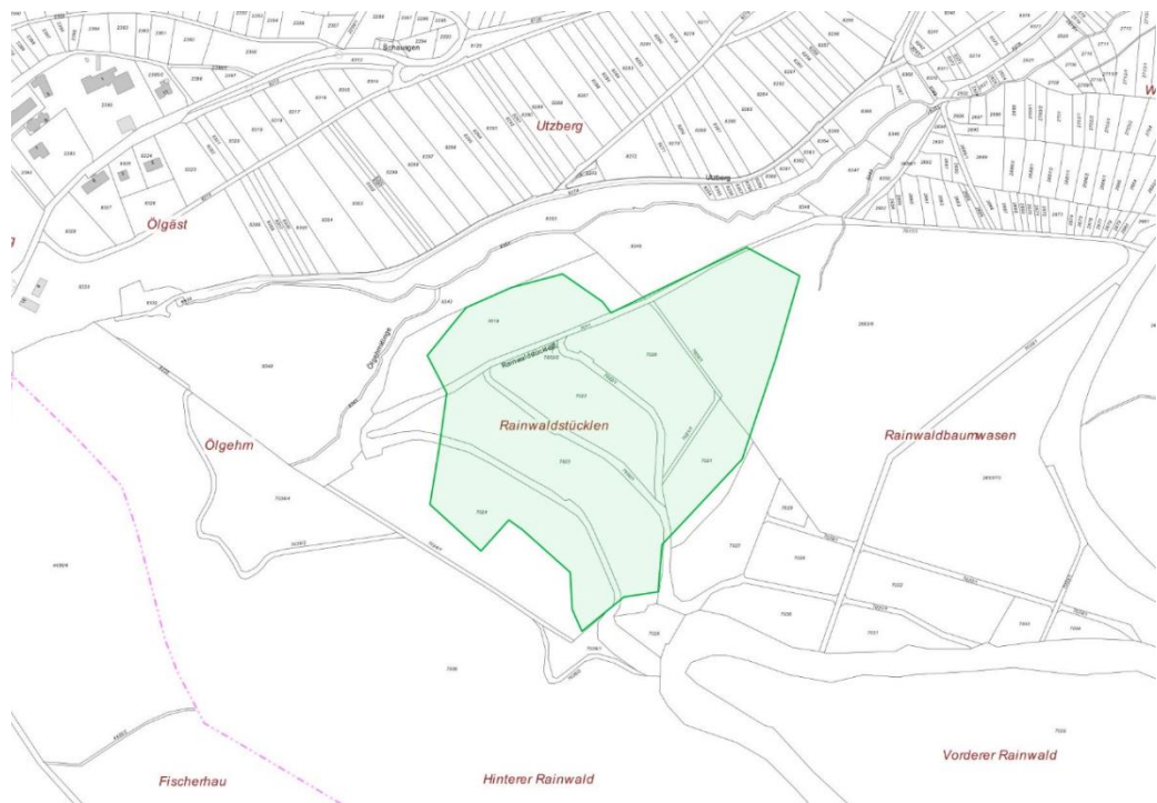
Abbildung 3: Lageplan der Maßnahme E3 Wiederherstellung artenreicher Streuobstwiesen Rainwald