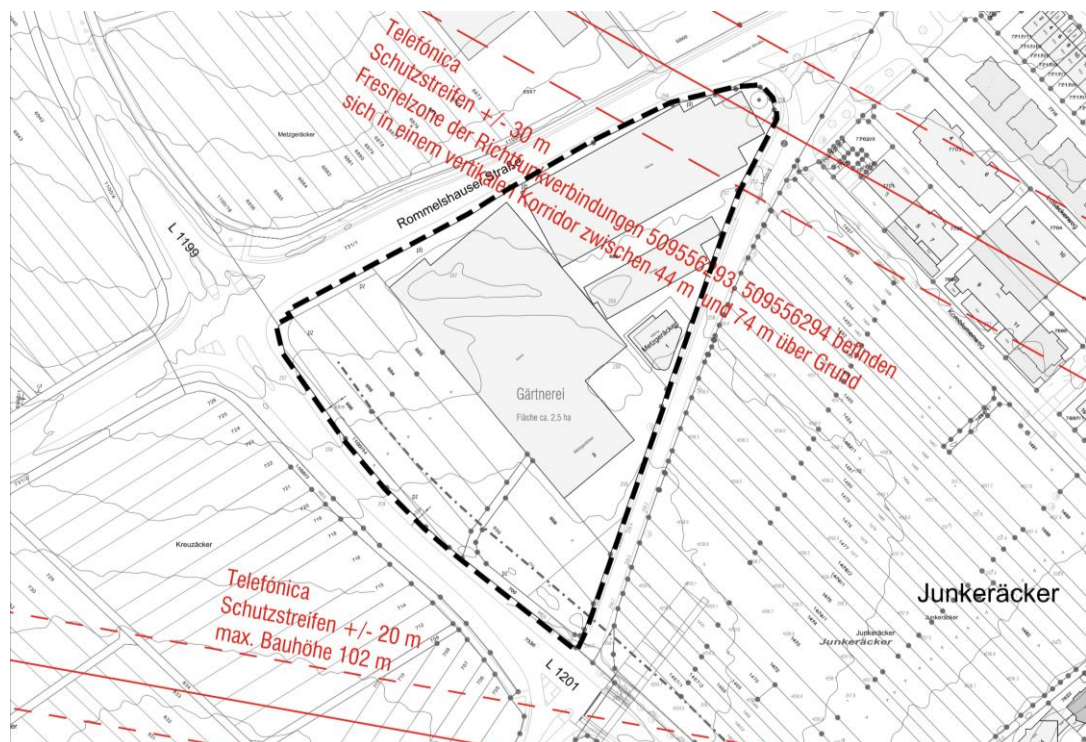
Abbildung 2: Übersicht vorhandener Richtfunktrassen mit Schutzabstand, Stand Oktober 2018

Über den Geltungsbereich läuft die Richtfunktrasse der Telefónica Germany GmbH & Co. OHG. Die genannte Mobilfunktrasse ist aufgrund ihrer Höhenlage für die Bebauung nicht von Belang. Allerdings muss bei der Aufstellung von Kränen die höhenmäßige Beschränkung durch die Mobilfunktrasse berücksichtigt werden.