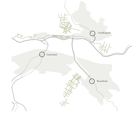
Anbindung der historischen Ortskerne Beutelsbach, Enderbach und Großheppach an die Rems

Das Erleben der Rems und ihrer Nebenflüsse sowie eine neue grüne Mitte – in Form des neuen Bürgerparks – soll die Identität Weinstadts stärken und die Ortschaften zueinander in Beziehung setzen. Die Ortskerne Beutelsbach, Großheppach und Enderbach sind bereits durch die Bachläufe (Schweizerbach, Heppach und Haldenbach) mit der Rems verbunden. Die Verdichtung der Bachläufe verhindert jedoch die Wahrnehmung dieses Zusammenspiels. Eine partielle Öffnung der Bachläufe bzw. eine alternative Gestaltung, z.B. durch Baumreihen, die den Verlauf der Bäche nachempfunden, soll die Verbindung der einzelnen Ortschaften mit der Rems wieder zum Vorschein bringen. In den Mündungsbereichen der Zulüsse in die Rems sorgen Brücken für eine Anbindung der südlichen Ortschaften an das Nordufer der Rems.