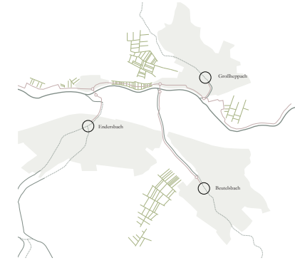
Anbindung der historischen Ortskerne Beutelsbach, Enderbach und Großheppach an die Rems

In den Mündungsbereichen der Zulüsse in die Rems sorgen Brücken für eine Anbindung der südlichen Ortschaften an das Nordufer der Rems.