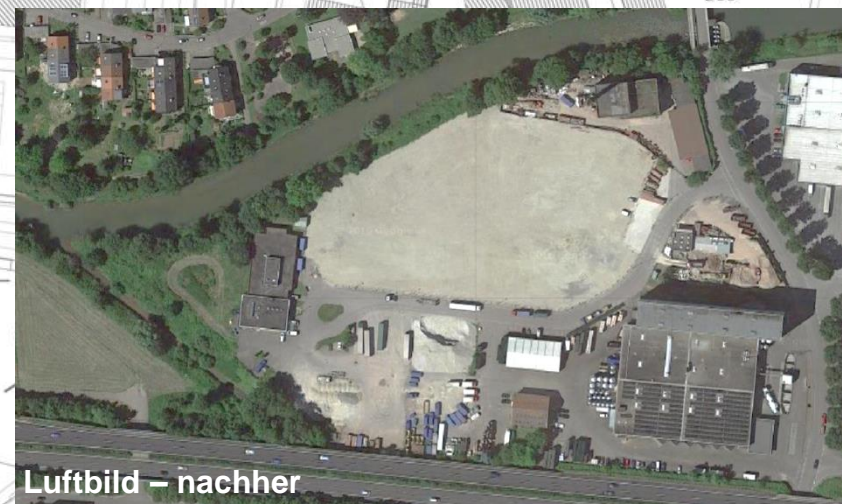
Luftbild – nachher