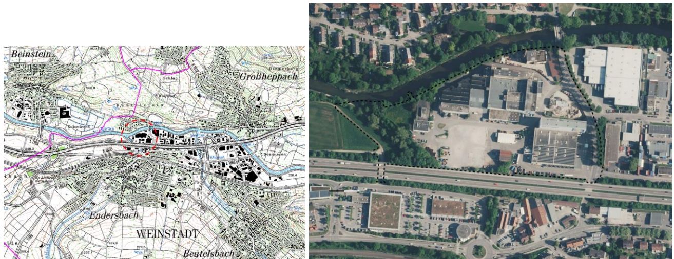
Abb. 3: Bebauungsplan und örtliche Bauvorschriften „Birkelstraße“ in Weinstadt – Entwurf vom 23.06.2017 (BALDAUF ARCHITEKTEN UND STADTPLANER GMBH, 2017)