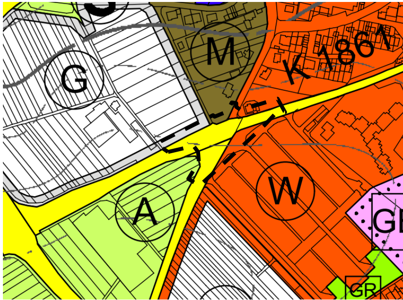
Abbildung 1: Auszug aus dem Flächennutzungsplan 2015