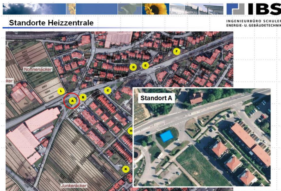
Abbildung 6: Standortfindung IBS, Ingenieurbüro Schuler, im Rahmen der Studie Weinstadt Endersbach West Quartierskonzept von ebök, Tübingen Oktober 2015