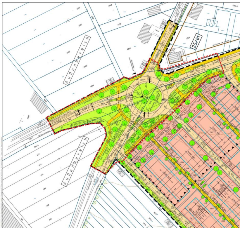
Abbildung 2: Auszug aus dem Bebauungsplan „Halde IV“ vom 02.05.2002 mit Abgrenzung des Plangebiets

Innerhalb des Geltungsbereichs gilt derzeit der rechtsverbindliche Bebauungsplan „Halde IV“ vom 02.05.2002, welcher durch die Bebauungsplanänderung „Halde IV- 1.Änderung“ überplant wird. Der Bebauungsplan „Halde IV“ setzt für die süd-östlichen Bereiche allgemeines Wohngebiet fest.