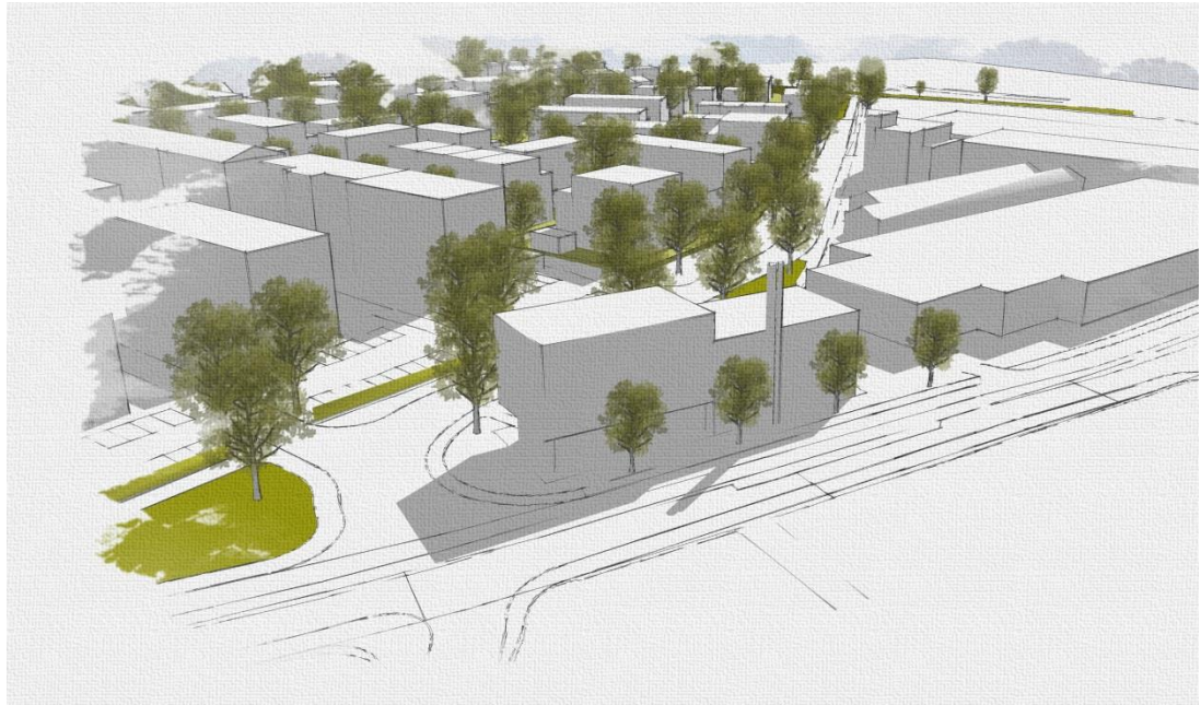
Abbildung 4: 3D-Modell des städtebaulichen Konzepts Endersbach West ( Halde IV und Halde V), Baldauf Architekten und Stadtplaner GmbH, April 2017, Blick von Norden

Geplant ist ein drei bis vier geschossiger Gebäudekomplex parallel zur Rommelshäuser Straße, der eine gestaffelte Höhe drei Geschossen nach Westen und vier Geschossen zum Kreuzungsbereich aufweisen kann. Die Erschließung erfolgt zum einen über die Rommelshäuser Straße über eine Tiefgaragenzufahrt und zum anderen über die Straße Metzgeräcker. Hier sind private oberirdische Stellplätze vorgesehen.