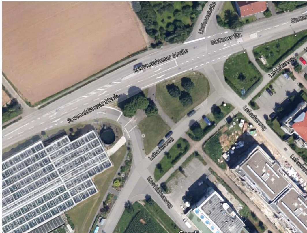
Abbildung 3: Luftbild